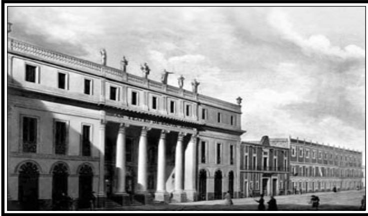
Teatro Santa Anna. Óleo sobre tela de Pedro Gualdi.

nombres que se le dieron al dictador, en obsequio a su infatigable labor patriótica.