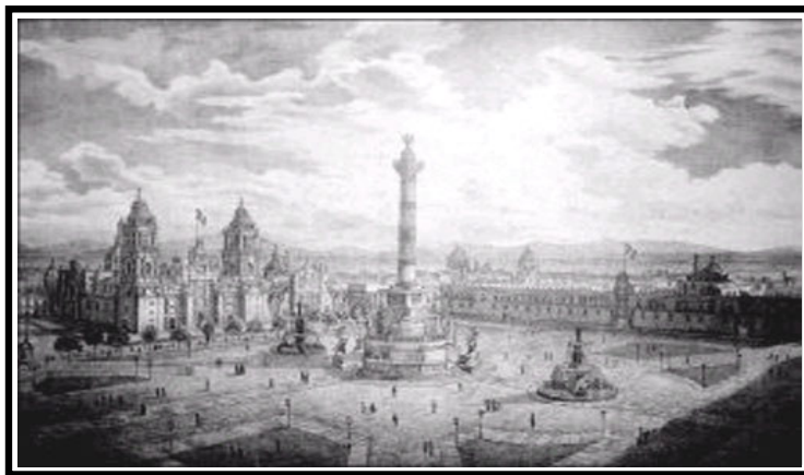
Primer monumento a la independencia.

El embellecimiento de la ciudad era parte de los planes de “regeneración” que el General-Presidente tenía en mente, y esta obra era parte de ello. Una vez demolido el viejo mercado, se pensó en un enorme columna coronada por una figura alada, más alta que las torres de la Catedral.