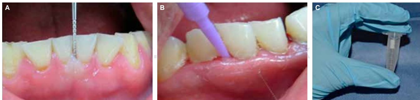
Figura 1. Examinación clínica y toma de muestra. A) Exploración clínica intraoral con sonda periodontal. B) Toma de muestra en pacientes con bolsas periodontales. C) Almacenamiento de la muestra con PBS1X.

Clinical examination and sample taking. A) Intra-oral exploration with periodontal probe; B) sample collection in patients with periodontal pockets; C) sample stored in PBS1X.