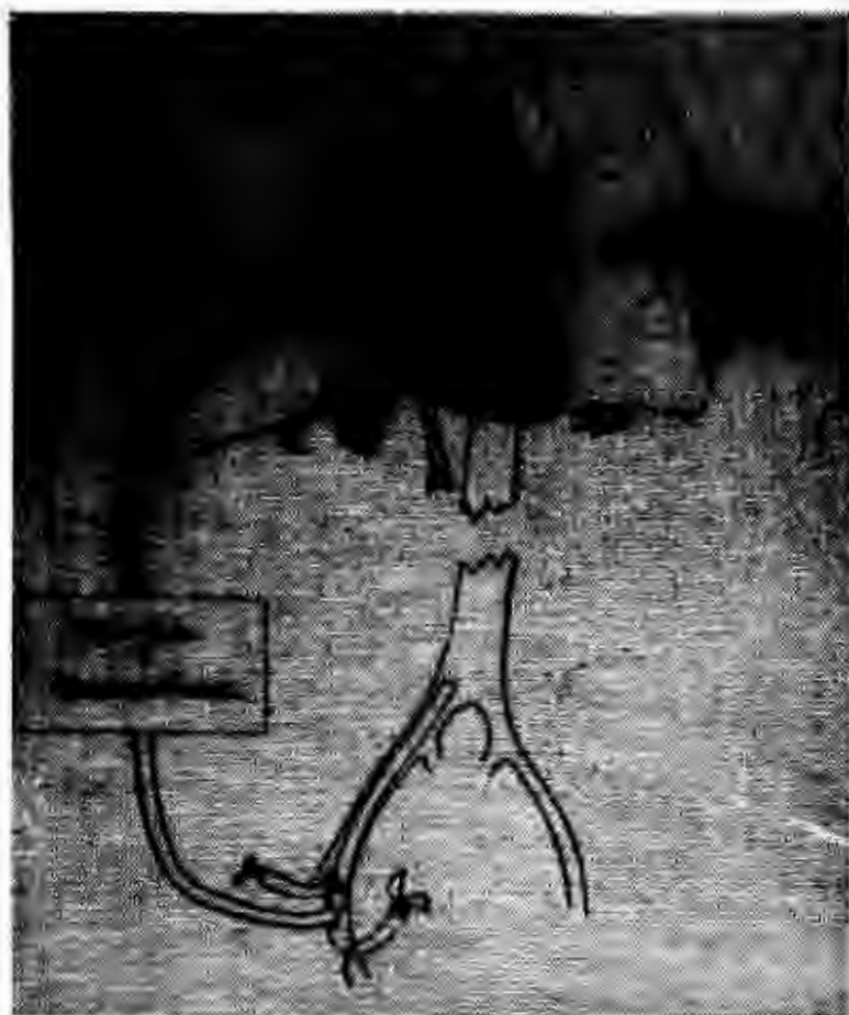
Fig. 5. Embolectomia con circulación extracorpórea, aspiración de embolos y expresión del parenquima pulmonar (Beall y Cooley, 1965).