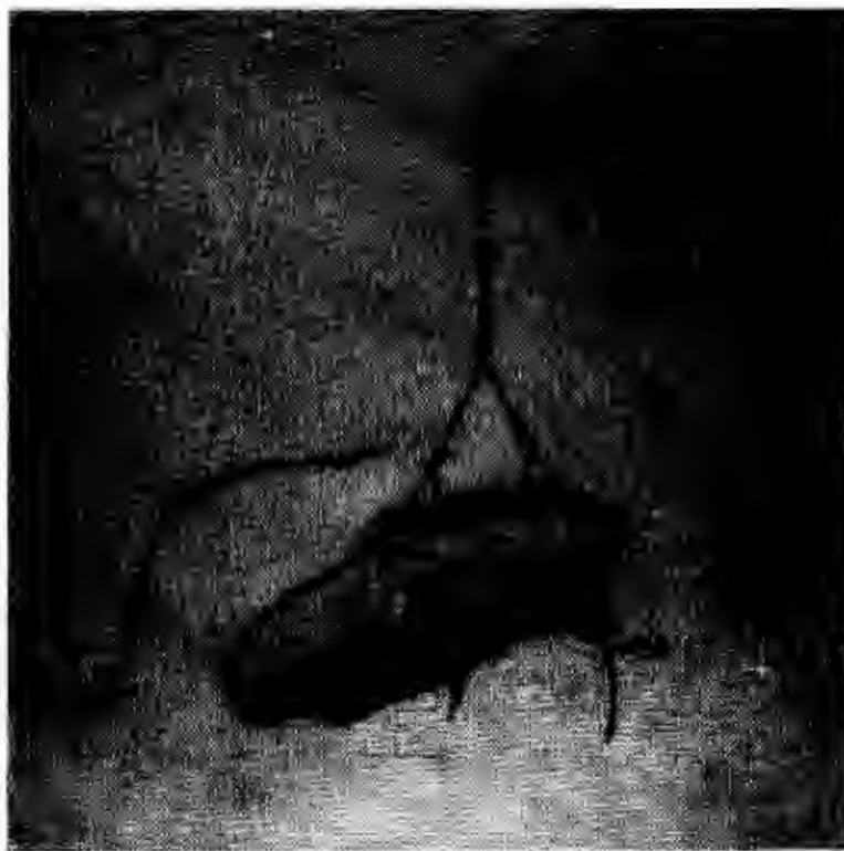
Fig. 3. Tracción costal en contusión profunda de tórax.