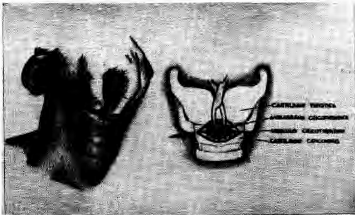
Fig. 2. Cricotirotomía. Izquierda: palpación de la unión cricotiroides. Derecha: incisión transversal y apertura de la membrana cricotiroides.