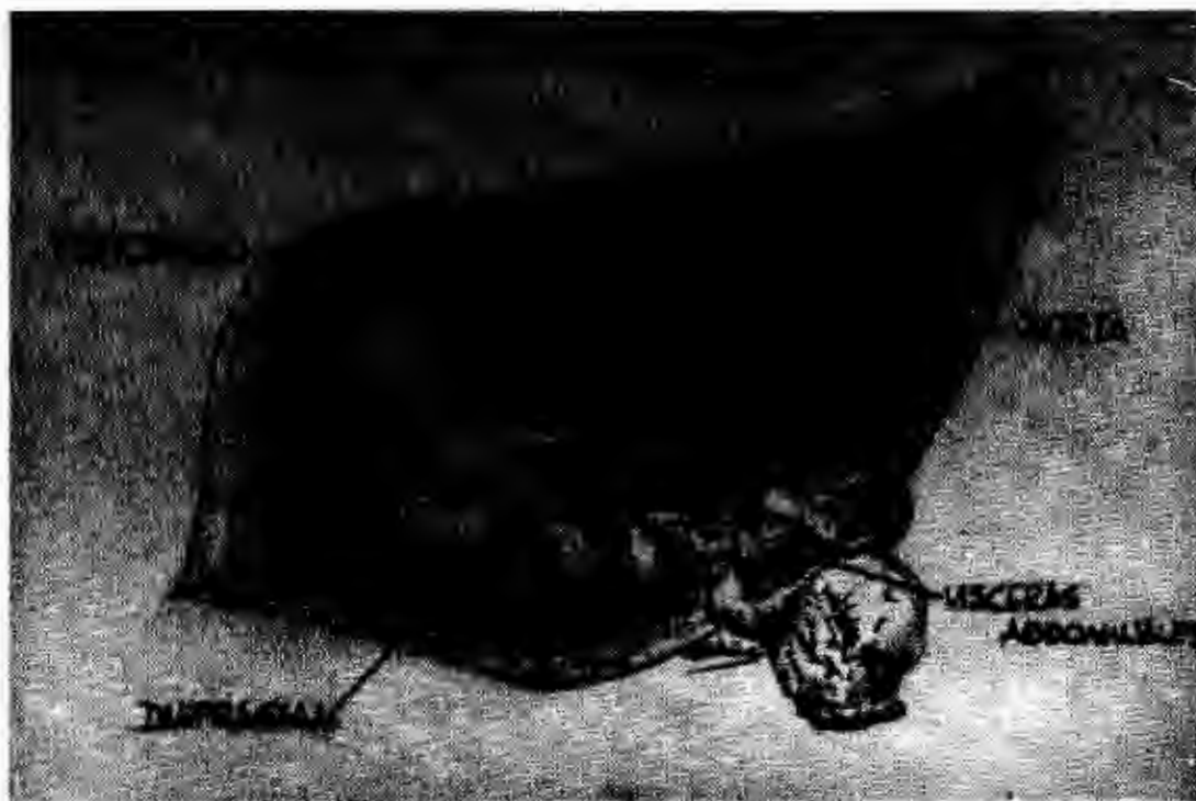
Fig. 4. Reducción de hernia diafragmática traumática por toracotomía.